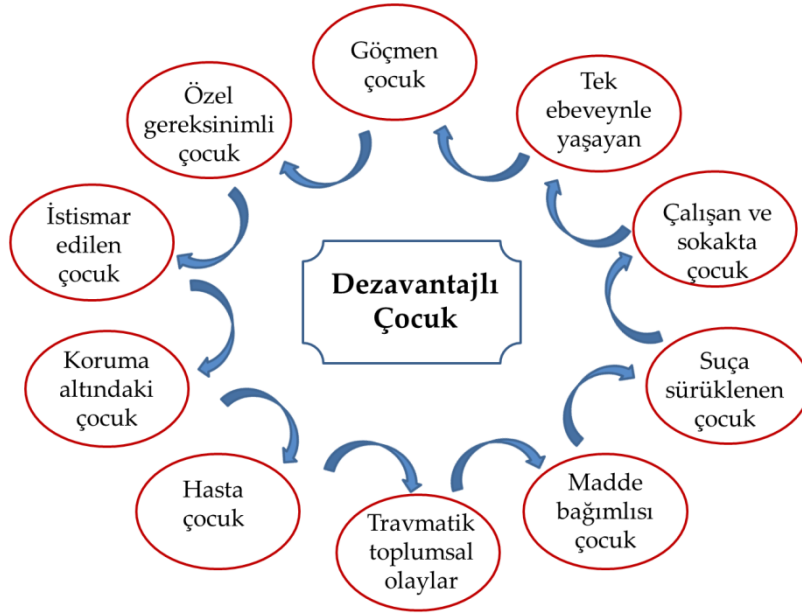
Şekil 3. Dezavantajlı çocukların sınıflandırılması

gelişimi zedelenmektedir. Başka deyişle tek bir riskli durum değil, çoğu zaman birkaç farklı riskli durumla karşı karşıya kalmaktadır. Dezavantajlı çocukların sınıflandırılması, Şekil 3’de özetlenmiştir.