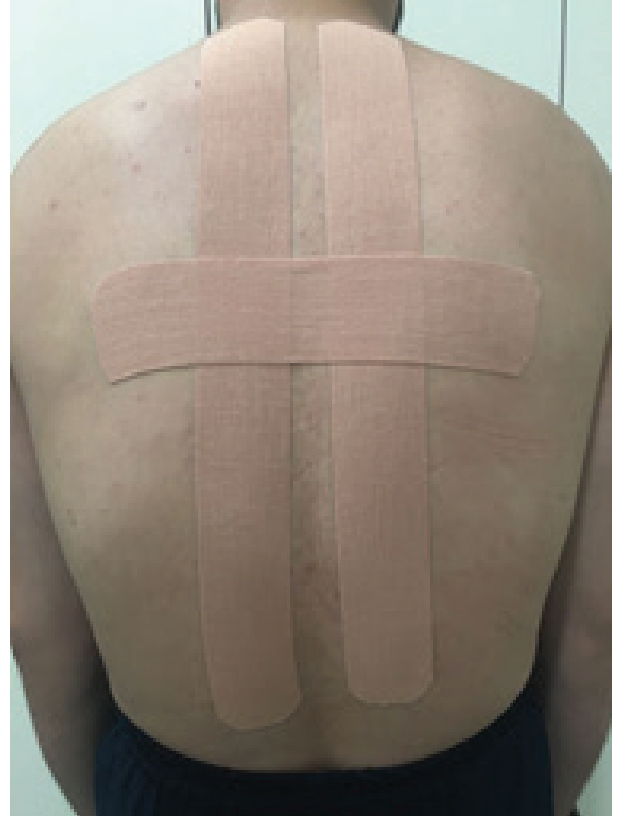
Şekil 1: Kinesio® Bant Uygulaması. (A) Lateralden Görünüm ve (B) Posterior Görünüm.

yoterapist tarafından, sırt bölgesine dört hafta boyunca haftada bir kez yapıldı. KT uygulamasından önce cilt alkolle temizlendi ve sırt bölgesinde aşırı tüylenme bulunan hastalara uygulamadan en az bir saat önce bölgeyi temizlemeleri söylendi. Bandın alerjik olmadığı bilinmesine rağmen alerjik durum tespiti için bireyin omuzuna bir parça bant yapıştırılarak alerji testi yapıldı. Çalışmanın başında, sadece bir hastada banda karşı alerjik reaksiyon gelişti ve hasta çalışma dışı bırakıldı. Bu hastanın yerine bir başka hasta çalışmaya dahil edildi. Plasebo etki oluşturmaması için hastaların tümüne ten rengi KT (Kinesio® Tape Tex Gold Classic Bant, Kinesio Tex, Tokyo, Japonya) kullanıldı. C7'den L1'e kadar paraspinal kaslar üzerine % 25-50 gerimle bilateral olarak I şerit bant vertikal şekilde uygulandı. Ayrıca kifozun en belirgin olduğu bölgeye I şerit bant horizontal olarak bandın ortadaki 1/3'lük alanına gerilim verilerek alan düzeltme tekniği uygulandı (Şekil 1). Hastalar düzenli olarak aranarak egzersiz protokolüne uyup uymadıkları ve bandın durumu sorgulandı. Bantta herhangi bir bozulma olduğunda uygulama yenilendi. Çalışma boyunca sadece iki hastada (bir hastada ilk hafta, ikinci has-