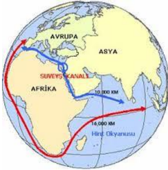
Süveyş Kanalı Projesi