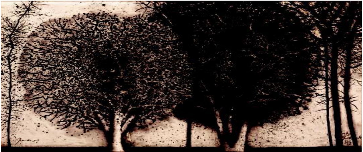
Görsel 5: Kırmızı Alpillen (1978) | Bakır üzerine aside yedirme baskı ve kazıma, 57x76cm

Metal yüzey çeşitli genişliklerde kuru toz vernik ile püskürtülür, eritilir ve aşağıda ısıtma ile yapışır. Asit küvette battığında, serpilmeyen yerlerde asit vardır. Nokta-benekli dokular elde edilmiş olur. Birçok baskı teknikleri ile birlikte uygulanır. Aşağıdaki görsel buna örnek olarak verilmiştir. Metalin yüzeyine değişik kalınlıklarda kuru toz vernik serpilir, alttan ısıtılarak eriyip yapışması sağlanır. Asit banyosuna batırıldığında serpintiyi almayan yerleri asit yer. Nokta serpintili doku elde edilir. Akuatint tek başına çok az kullanılır ve diğer tekniklerle birlikte uygulanır. Metal plakanın birebir oyulması yerine plakanın zemini, asitle dayanıklı bir vernik ile kaplanmaktadır. Plakadaki desen verniği kazıyarak çıkarır. Daha sonra plaka asit banyosuna daldırılır. Desen çizgili yerlerde metal asit erimeye başlaması sonucu çukurlar oluşur. Çukurların derinliği asit emme süresi ile belirlenir ve aslında gravür gibi basılmış olur (Smith, 2010).