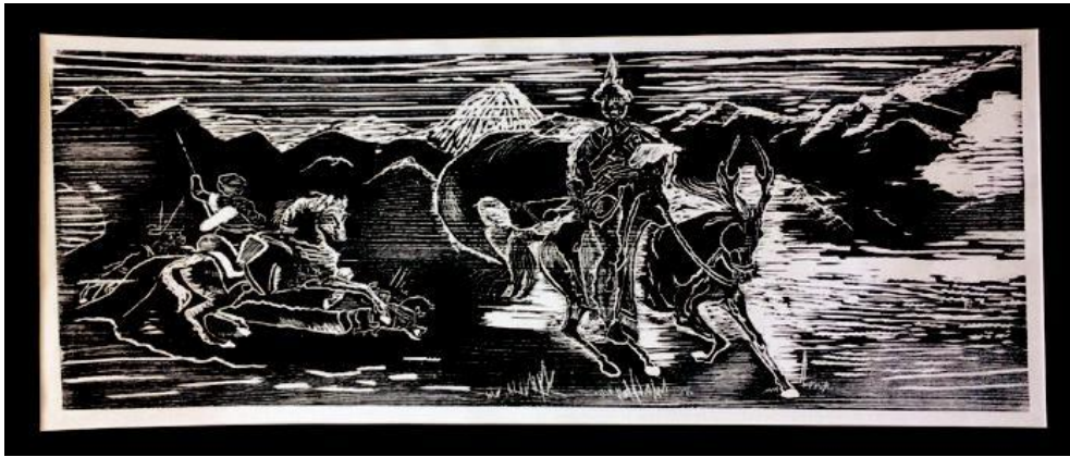
Görsel 1: Özgül ATEŞ Ağaç Baskı 30x80cm

Özgün Baskı resim tarihsel gelişimi ele alındığında, kökeninin insanın ilk üretimini yaptığı mağara duvarındaki resimlere dayandığı görülmektedir. M.Ö. 3000 yıllarında yazının, daha sonraları da M.S.105 yıllarında Çin'de kâğıdın bulunmasıyla, basım işi yeni bir nitelik kazanmıştır. Özgün baskı kalıbının yapılışı tasarımı seçilen malzemeye göre değişiklik gösterir kullanılan baskı makinesine göre de şekillenmiş olur. Özgün baskı değişik baskı malzemeleri ile çoğaltılmış grafiksel bir sanat yapısıdır. Yapılan çalışmaların özgün baskı sayılabilmesi için çoğaltılmak amacı ile yapılması gerekir. Bir yüzeydeki oluşumu bir başka yüzeye aktarılması sonucu çoğaltılıp basılması süreci içinde gerçekleşen eser bir grafik tasarım ürünü de ortaya çıkarır. Baskı tekniği sayesinde de az sayıda kopya yerine çok miktarda baskı çoğaltılması mümkün olmuştur.