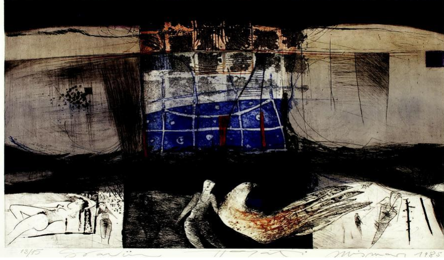
Görsel 8: Hayati MİSMAN, "İsimsiz", 1985, Gravür, 70x100