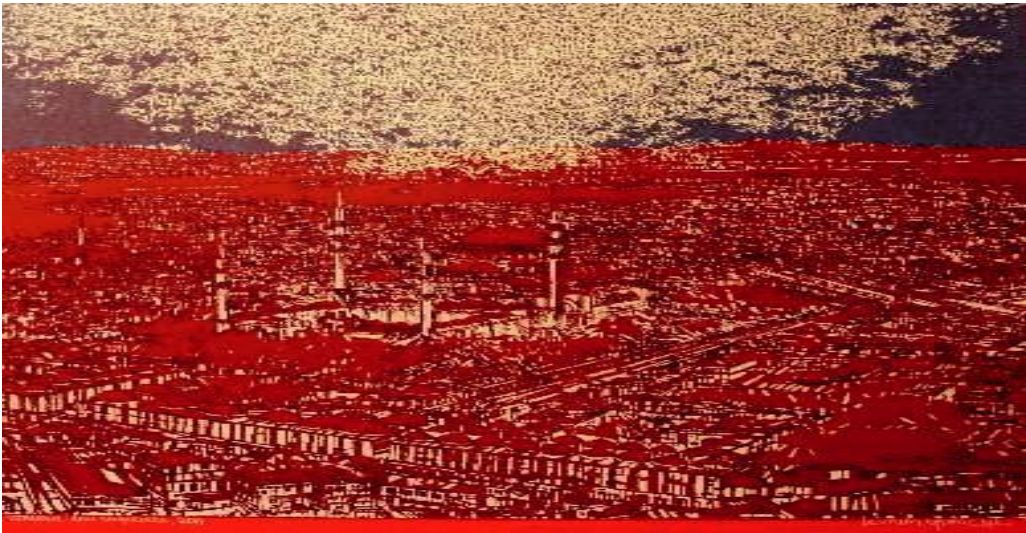
Görsel 3: İstanbul'dan aşk “, serigrafî, Devrim Erbil

Sanatçılar tüm teknikler için genellikle bir ön çalışma yaparlar. Örneğin Devrim Erbil'in "İstanbul'dan Sevgilerle" isimli eserinde, seri basımının farklı teknikleri üzerine serigrafî çalışması yapmıştır. Sadece bir tuval oluşturarak, orijinal bir baskı resmi için suluboya ile bir ön hazırlık yapılır. Taslaklar daha sonra tekniğe uygun olarak işlenerek ve sanatçı kalıpları zaman içinde farklı aşamalardan prova eder ve ilk ön ve son görüntüye ulaşıldığında kanıtı yazdırır. Baskı, bir sanatçının çalışması için çok ciddi bir sanat üretim kapasitesi gerektirir (Limon:2011:9).