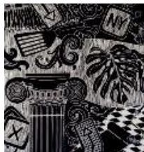
Görsel 4: Linol baskı, Nevin YAVUZ 2009

Bu teknikte, muşamba ve muşamba bıçaklarıyla oyulmasıyla bir kalıp hazırlanmaktadır. Linol baskı sanatında da ağaç baskıda olduğu gibi, her bir renk için farklı çeşitli kalıplar hazırlanmalıdır. Muşambaya'ya benzeyen plastik bir malzeme olan linolyum, kolaylıkla oyma ile şekillendirilebilir, baskı tekniğinde ahşaptan daha çok tercih edilir. Linol baskı için kullanılan malzeme, linol gravür bıçaklarıyla kazınmalı ve daha sonra baskı mürekkebi ve silindirler ile boyanmalıdır. Bu teknikte sadece yüksek parçaların kâğıt üzerinde olduğu görülür ve kâğıt üzerinde linolün oyulan alanları beyaz görünür.(Misman, 1976:26).