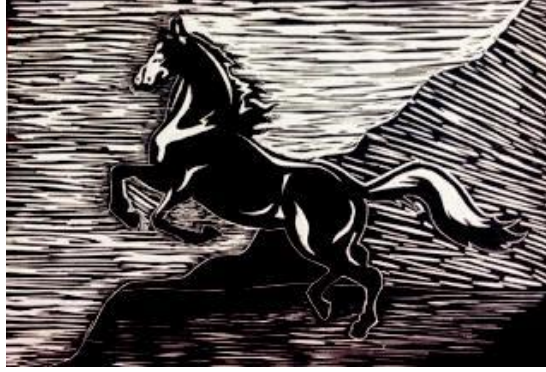
Görsel 2: Özgül ATEŞ Ağaç Baskı 30x30cm

Bir başka tanıma göre ise özgün baskı sanatı; akla ilk gelen şey çoğaltılabilme özelliğinden kaynaklanan sanatı kitlelere aktarmada daha etkili bir araç olmasıdır. Fakat unutulmamalıdır ki özgün baskı Postmodernizm'in yeniden oluşturulması ve anlamlandırılması kargaşasından hâlâ kurtulamamıştır. Sanatçılar farklı görsel anlatımlara tekniklerine olanak sunarak görsel anlamdaki çeşitliliğe farklılık oluşturmasına neden olur. Sanatçılar; siyasi anlamda hangi ideolojiye hizmet ederse etsin, bu baskı tekniği sayesinde kendini ve önemini kanıtlamış olur.