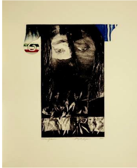
Görsel 6: Görsel 6: Gravür 33x45 cm

Ankara'da sergilenen son yapıtlarında da sözkonusu teknikleri içeren geniş bir yelpaze sunar ve izleyici de sanatçının özgün dili bağlamında fikir sahibi olur, “yetkin” liği algılar. Sanatçının yağlıboya, çağdaş kadın imajı çerçevesince oluşturulmuş, çizginin, ritmin ve hareketin hissedildiği, canlı mavi, kırmızı ve yeşillerin kullanıldığı istikrarlı çalışmalarının bir uzantısıdır. Kendi içinde gelişim ve değişim yakalamayı ilke edinen sanatçı, bahsedilen istikrarını, kompozisyon üzerinde bilinçli olarak kurduğu denetim sayesinde tekrara düşme-den korur. Kadın, kuş gibi sembolik figürler, mavi, kırmızı, yeşil, pembe, beyaz... gibi kullanılan renkler, dans eden, yatan, oturan kadın bedenleri Misman'ın vazgeçemedikleridir. Ayrıca sanatçı, figürlerinin anatomilerini değiştirebilir, üzerinde oynayabilir dolayısıyla figürlerin orantıları alışılmışın dışında olabilir bu da resimdeki mekân yerçekimi ya da perspektifle açıklanamayacak şekilde belirsizleştirir (Nurol Sanat Galerisi, 2003).