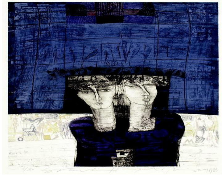
Görsel 7: Hayati MİSMAN, “İsimsiz”, 1986, Gravür, 98x65 cm

Türkiye’de özgün baskı resim sanatçılarından birisi olan Hayati Misman sanatı ve yapıtları üzerine yıllarca pek çok yazı yazıldı sanatını irdeleyen kataloglar yayınlandı görsel medya üzerinde pek çok başarılı çalışmaları ve sergilerine yönelik çalışmaları yapıldı. Özkan Eroğlu; Sanatçı, özgün baskı alanında ustaca kullandığı resimsel özellikler’den birisi de çizgi tekniğidir. Yapmış olduğu çalışmalarda sanatçı işlediği bir konuyu tekrar-lamadığını gösterir eserlerinde. ‘Belki de bir insanı sanatçı yapanda budur’ demiş (Nurol Sanat Galerisi,2003).