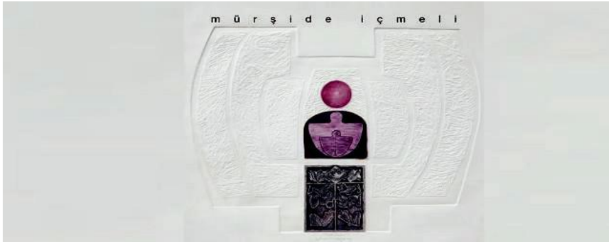
Görsel 9: Mürşide İÇMELİ, "İsimsiz", 1991, Litografi, 25x35 cm

açıdan ulaşılan yetkinlik olarak tanımlanabilir. İçmeli'nin yetkinliği yaptığı işe saygınlıktan kaynaklanır. O saygı da kişilikten gelen bir disiplin var, İçmeli'nin çalışmalarındaki yetkinliğin diğer bir boyutu çalışmalarındaki titizliktir. Bu titizlik salt işçilik yönünden değil, sürekli olarak daha yetkin tasarım elde etme, kılı kırk yaran bir düzenleme oluşturma, dolu ve boş alanlar ile düz ve kabartmalı yüzeyler arasında denge kurma, renk seçimi, renkler arasındaki uyum gözetme konusundaki titizliktir 81 . İçmeli'nin sanat anlayışının oluşmasında; sanatsal yeteneği yanında Anadolu kültürden başlayarak Anadolu topraklarına yerleşen uygarlıkların zengin kalıntıları, halı kilim gibi Anadolu halk sanatlarının formları, Avrupa sanatına, savaş yıllarının acıları, çocuk-luk yıllarından başlayarak etkilendiği yaşadığı deneyimler ve araştırmacı kimliği etkili olduğu söylenebilir (Senyapılı, 1988:69-70). sanat anlayışı, eserlerinde kurulan denge ve düzen ile kullanılan öğelerin seçimindeki kesinliği, izleyiciye daha az öğeyle çok fazla şey söyleyebilmesi, yalın tasarımların güçlü duygusal iletimi, geometrik teknikleri kullanmanın ustalığı, çağdaş ifade arayışı, bilim insanının tutumu ile sanatsal kurguya yaklaşımını çalışmalarında görmüş oluyoruz.