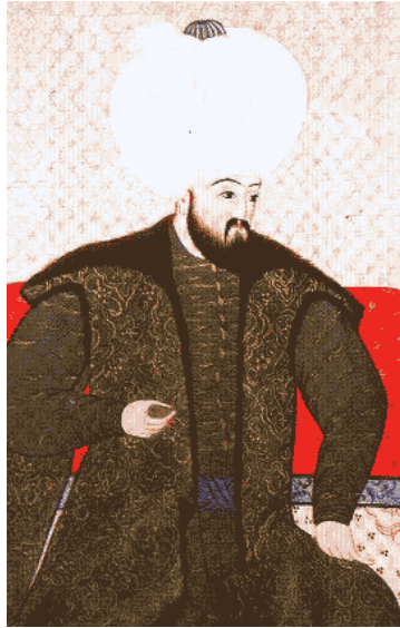
Şeyhülislam Ebussuut Efendi

“Yiğit, delikanlı” anlamındaki feta kelimesinden gelen “fetva” (füt-ya, çoğulu fetava, fetavi) sözlükte “Herhangi bir olayın hükmünü açıklayan veya hükmünü koyan, güçlükleri çözen kuvvetli cevap.” anlamındadır. Fıkıh terimi olarak fetva; fakih bir kişinin sorulan fıkhi bir meseleye yazılı veya sözlü olarak verdiği cevap, ortaya koyduğu hüküm demektir. Örfe